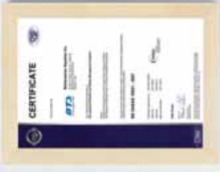
▶ DGS : BS OHSAS 18001 : 2007