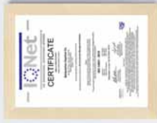
▶ IONET : ISO 14001 : 2015