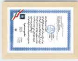
▶ Iran National Standard for BTS Fittings