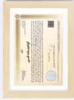
▶ Technical Approval for BTS Multi-layer Pipes