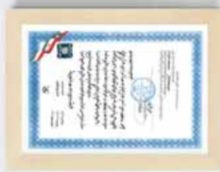
▶ Iran National Standard for BTS Multi-layer Pipes