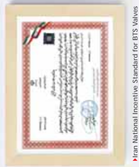
▶ Iran National Incentive Standard for BTS Valves