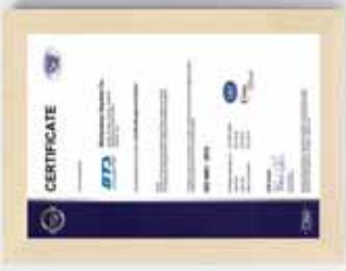
▶ DGS : ISO 9001 : 2015