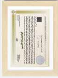
▶ Technical Approval for BTS Fittings