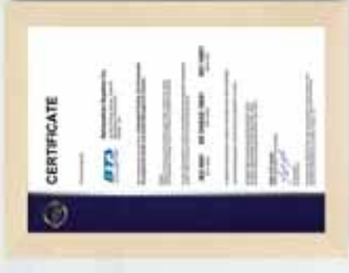
▶ DGS : IMS (Integrated Management System)