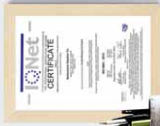
▶ IONET : ISO 9001 : 2015