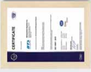
▶ DGS : ISO 14001 : 2015